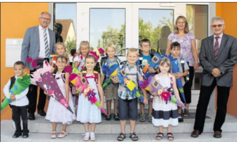
Zehn Mädchen und Buben starteten an der Grundschule Steinberg am See ins neue Schuljahr.