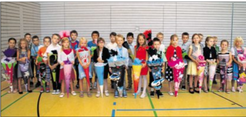
In Bodenwöhr begannen 28 Kinder, die sich auf drei Kombiklassen aufteilen.