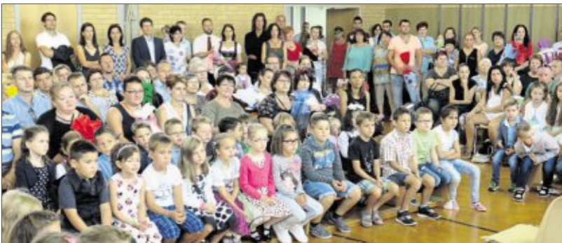
67 Abc-Schützen der Lindenschule Schwandorf versammelten sich mit ihren Eltern in der Turnhalle und verteilten sich anschließend auf drei Klassen.