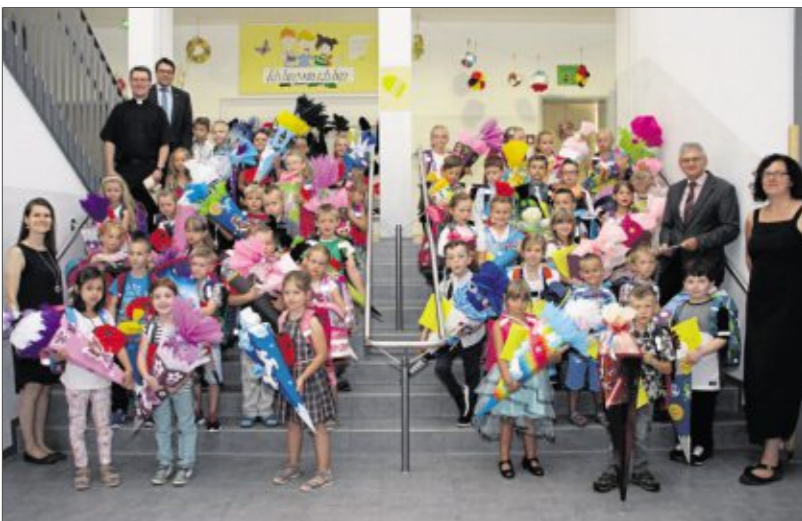
Auch in Wackersdorfer begann für die Buben und Mädchen die Schulzeit.