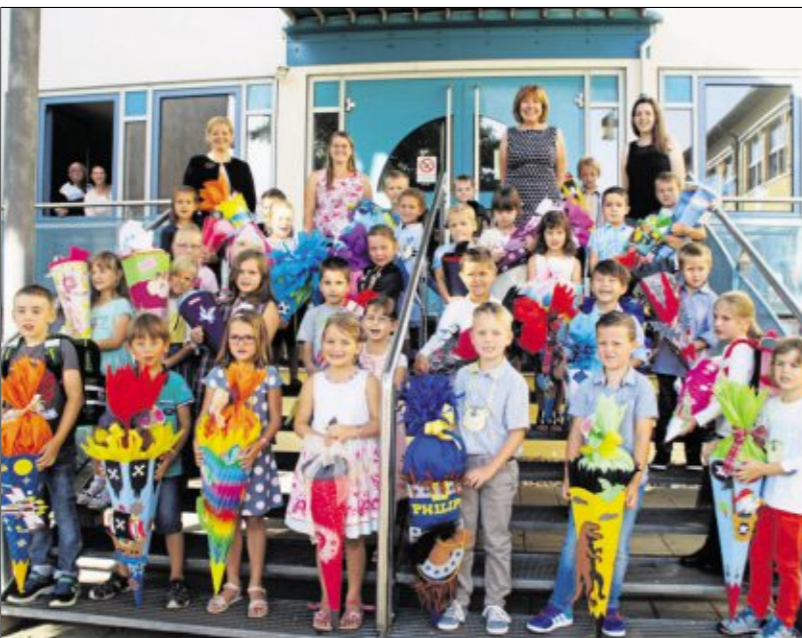
In der Grund- und Mittelschule Bruck 33 Abc-Schützen werden in drei Kombiklassen unterrichtet.