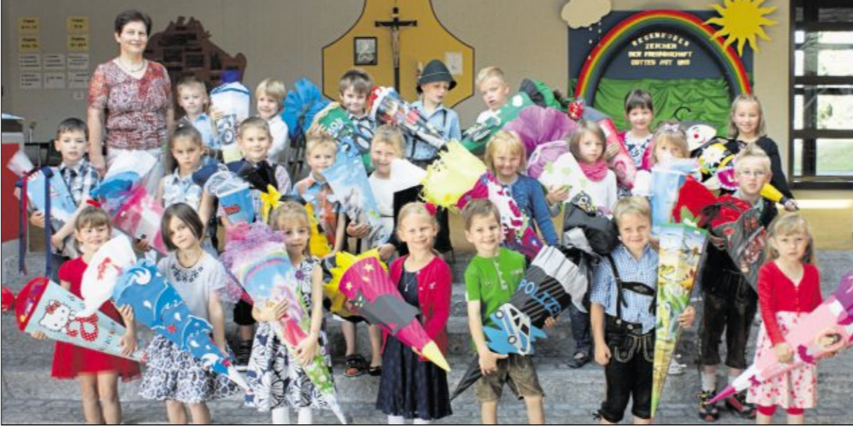
23 Erstklässler aus dem Schöneer Land fanden sich gestern in der Grundschule Schöneer Pfistermeister, zugleich Klassenleiterin, begrüßte die 12 Mädchen und 11 Buben.